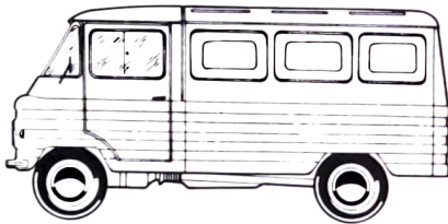
LIEFERWAGEN ZUK A-06

Der Zuk A-06 unterscheidet sich von dem bekannten Zuk A-13 in seinem Aufbau. Dieser zeichnet sich durch Dichtheit und sorgfältiges Finish aus und gestattet so die Beförderung von Stückgütern, die einen wirksamen Schutz gegen Staub und Regen erfordern. Eine Seitentür auf der rechten Fahrzeugseite erleichtert das Be- und Entladen. Der Lieferwagen kann auch mit einem Aufbau mit Fenstern geliefert werden. Die Fahreigenschaften sind dieselben wie beim Zuk A-13.