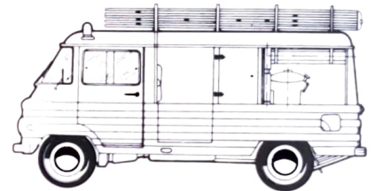
LÖSCHFAHRZEUG ZUK A-14

Der Zuk A-11 ist die neueste Ausführung des bekannten Lieferfahrzeugs Zuk A-03. Die Hauptveränderung bei dieser Ausführung ist die gänzlich neue Konstruktion des Ladeaufbaus, der jetzt offen ist, über eine vergrößerte Ladefläche verfügt und einen ebenen Fußboden hat. Der Ladeaufbau ist auch etwas höher gesetzt worden, um Radkästen im Fußboden zu vermeiden. Dies erlaubt, die Ladefläche zu vergrößern, und erleichtert das Beladen. Das Fahrzeug ist für die Beförderung von Stückgütern, Paketen und selbst von sperrigen Gütern bis 950 kg Gesamtmasse geeignet.